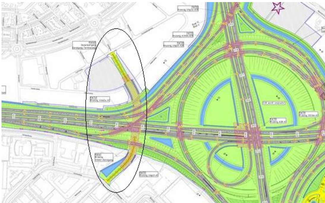
Figuur: OTB-kaart knooppunt Hoevelaken met Danzigtunnel

De nieuw te bouwen Danzigtunnel verbindt de bedrijventerreinen De Hoef en Bedrijvenpark Vathorst. De aanleg van de Danzigtunnel is als regionale wens gehonoreerd bij de aanbesteding van het knooppunt Hoevelaken door Rijkswaterstaat. Daarbij is afgesproken dat de gemeente zorgt voor de aansluiting van de tunnel op het onderliggende wegennet. Over een aantal jaar is de aanleg van de Danzigtunnel zover. Ter voorbereiding hierop willen wij het stedenbouwkundig plan en beeldkwaliteitsplan voor Bedrijvenpark Vathorst aanpassen.